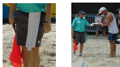
※写真はラインジャッジ