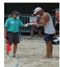
※写真はラインジャッジです